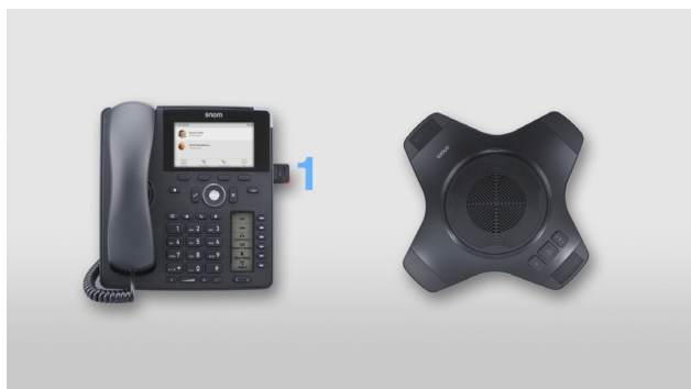
Conectar el adaptador al teléfono