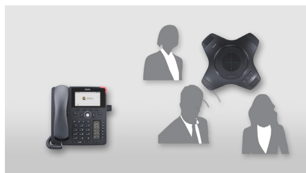
Ahora ya puede usar el altavoz inalámbrico hasta 25 metros de distancia