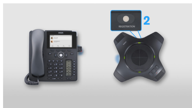
Establecer el enlace DECT con el altavoz inalámbrico